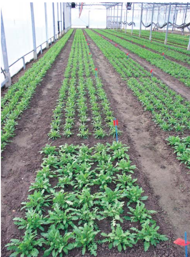
Versuchsanlage und Anzucht

4er Erdpresstopf-Floragard), Ernte = Ende April. Die Kultur erhielt keine Düngung, da lt. Nmin noch 300 kg N/ha aus der Vorkultur zur Verfügung waren. Die Bestände waren bis zum Ende der Kultur gesund, einheitlich und von guter Qualität.