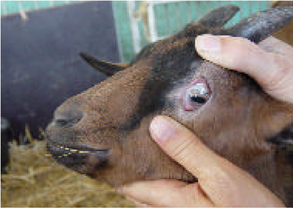
So werden die Lidbindehäute am Auge einer Ziege für einen Vergleich mit der FAMACHA-Testkarte freigelegt.

der bisher üblichen Gesamtherdenbehandlung erreicht werden. Dadurch reduziert sich der Selektionsdruck und wurmmittelempfindliche Stämme haben die gleichen Überlebenschancen wie die resistenten. Zunehmend wird empfohlen, zumindest einen kleinen Anteil der Herde unbehandelt zu lassen. Die gezielte Behandlung ist auch mit Einsparung von Entwurmungsmitteln verbunden; bis zu 90 % sollen möglich sein.