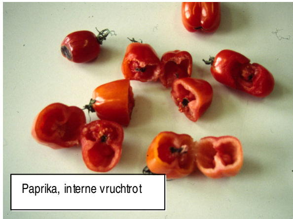
Paprika, interne vruchtrot

De Fusarium soorten die interne vruchtrot veroorzaakt groeien in eerste instantie binnenin de vrucht op de vruchthuid of het zaad. De eerste symptomen zijn necrose (zwarte plekjes) aan de binnenzijde van de vruchtwand, gevolgd door de groei van witroze schimmelpuis en het zwart verkleuren van de zaden. Pas bij een sterke uitbreiding van de infectie worden de symptomen aan de buitenkant zichtbaar. Deze symptomen zijn pas bij de oogst of enkele dagen daarna te zien. Er kunnen