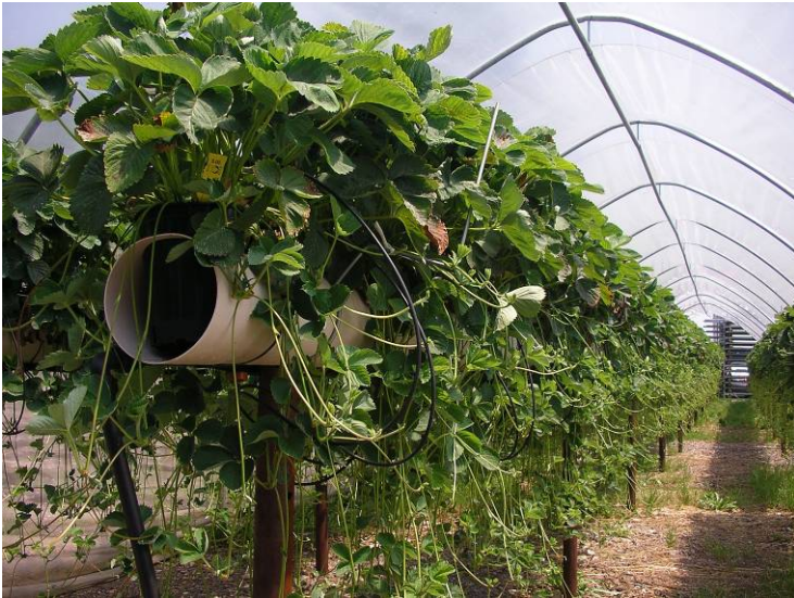
Mise en œuvre au Wauwilermoos, cette nouvelle méthode de reproduction de fraisiers biologiques s'inscrit dans le cadre du projet BBC.