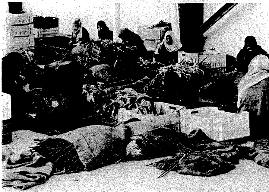
KVINDEARBEJDE – På Al Houda farmen skærer kvinderne rødderne af løgene, og binder dem i bundter. I pakkeriet tjekkes bundterne, inden de pakkes og sendes til europæiske supermarkeder som Tesco og Sainsbury.

For at sikre en fornuftig tilførsel af næringsstoffer har Al Houda også etableret en kødkvægsproduktion på cirka 500 styk. De indgår samtidigt i sædskiftet, hvor blandt andet restprodukter fra produktionen af baby-majs kan anvendes som foder. Der findes ikke en decideret afsætning af økologisk kød i Egypten, så de må sælges som konventionelle. Denne problemstilling slås mange af de af økologiske bedrifter med i Egypten, idet det ofte kun er enkelte højværdiafgrøder, som finder afsætning til eksport eller til det voksende hjemmemarked. Hjemmemarkedet er koncentreret omkring byerne Cairo og Alexandria samt hotellerne i turistområderne ved det Røde Hav. ■