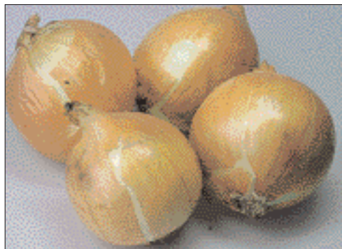
Fig. 2. La période de récolte est déterminante pour une bonne fermeté de l'enveloppe: oignons d'une culture dont le feuillage reposait au sol au moment de la récolte (en haut) ou était encore à demi érigé lors de la récolte (en bas).