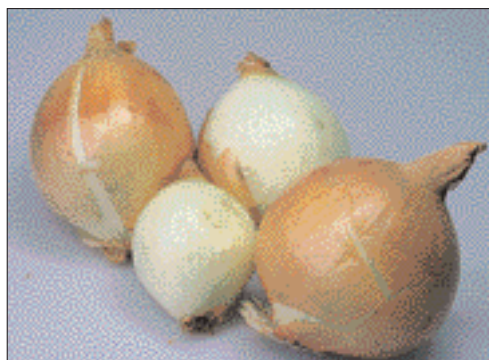
Abb. 2. Der Erntezeitpunkt ist für eine gute Schalenfestigkeit entscheidend: Zwiebeln aus einem Bestand, dessen Laub bei der Ernte am Boden lag (oben), und die eines Bestandes mit halbliegendem Laub zum Zeitpunkt der Ernte (unten).