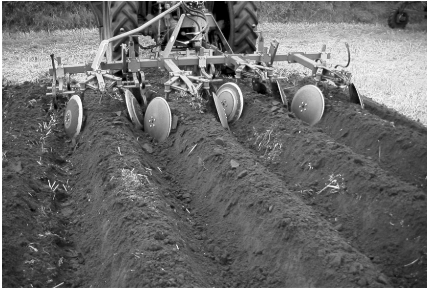
Figur 1. Opsætning af kamme med tallerkenhypper på sandjord.

Vi bruger kammene lidt anderledes. I stedet for at opsætte kammene i vækstsæsonen, opsættes de efterår eller forår. På lerjord stubharves der først, og derefter opsættes kammene ved to eller tre træk med en kartoffelhypper. Kammene bliver stående vinteren over, og efter en hel eller delvis udjævning om foråret sås der igen. På sandjord er proceduren den samme, bortset fra at der ikke stubharves.