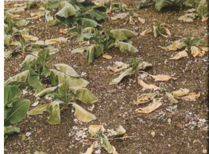
Bresych wedi'u difa gan larfau'r pryf gwraidd bresych

Mae'r rhan fwyaf o gnydau sy'n tyfu yn y DU yn cynnig llety i bla pryfed unigol neu luosog sy'n bwydo ar y planhigyn ar ryw adeg yn ei gylch bywyd. Nid pla pryfed yw'r term manwl gywir oherwydd bod y plâu'n dod o amrywiaeth eang o deuluoedd neu grwpiau gan gynnwys Coleoptera (chwilod), Diptera (gwir bryfed), Lepidoptera (ieir bach yr haf a gwyfynod), Molwsgiaid (gwllithod a malwod) a Nematodau.