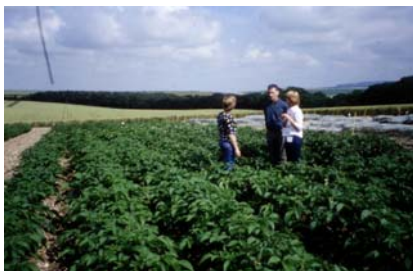
Mae archwilio'r cnwd yn gyson yn rhan bwysig o reoli plâu

Pryfed Hadau Ffa Y Pryf Moron Chwilod Chwilien Datws Cymynwyr Nematodau Rhyddion Llysleuen Gwraidd Letys Nadroedd cantroed a miltroed Y Pryf Nionod Chwimwyfyn Symfflidiad Meisgyn Bustl Maip Gwiddon Di-asgell