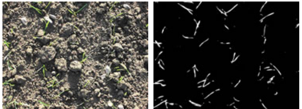
Figur 1 Eksempel på et billede fra harvet parcel (venstre) som er konverteret til et binært sort-hvid billede (højre).

I figur 1 illustreres et eksempel på et billede fra en parcel med vinterhvede, som er blevet harvet i 1-bladsstadiet. Billedbehandlingsprogrammet konverterer først farvebilledet til et binært sort-hvid billede, hvor de grønne blade bliver hvide, for dernæst at opgøre hvor stor en procentdel de hvide pixels udgør af det samlede antal pixels. I det pågældende tilfælde var det 2,57%. For at beregne afgrødetildækningen som følge af harvning er det nødvendigt med en ubehandlet reference. Visuel bedømmelse af afgrødetildækning i så tidligt et vækststadium som er angivet i figur 1 er forbundet med så stor usikkerhed, at det ikke kan bruges til ret meget.